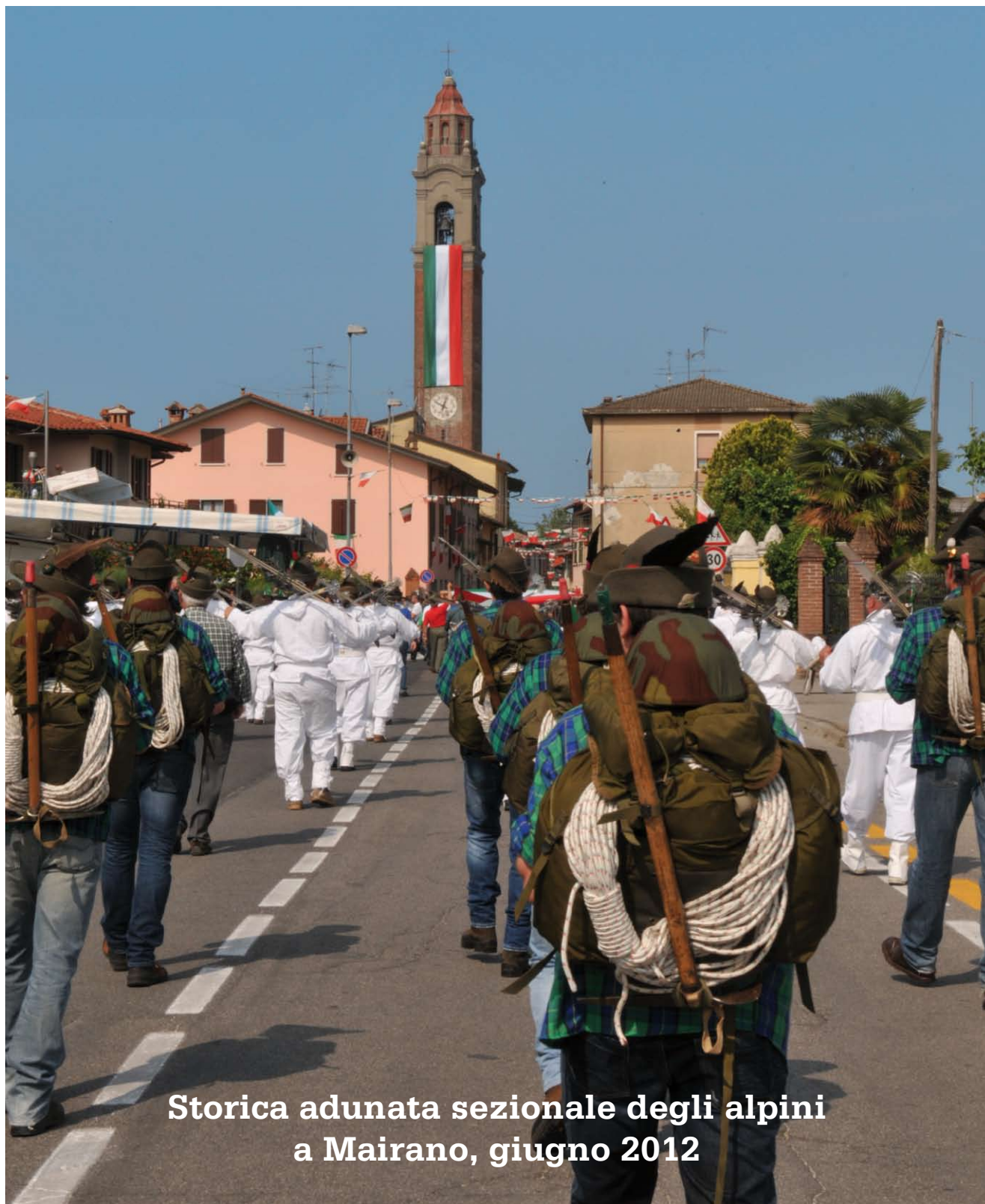
Storica adunata sezionale degli alpini a Mairano, giugno 2012