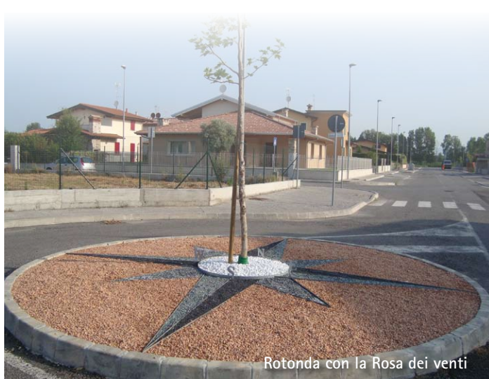
Rotonda con la Rosa dei venti