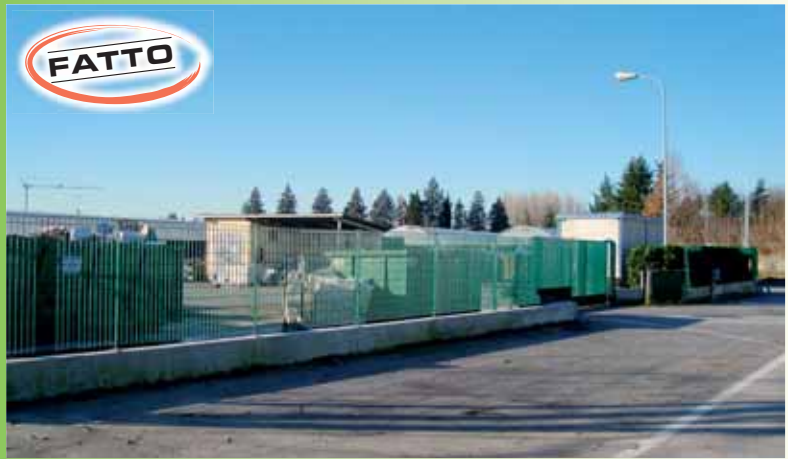
Ampliamento dell'Isola ecologica, costantemente monitorata dalle telecamere.