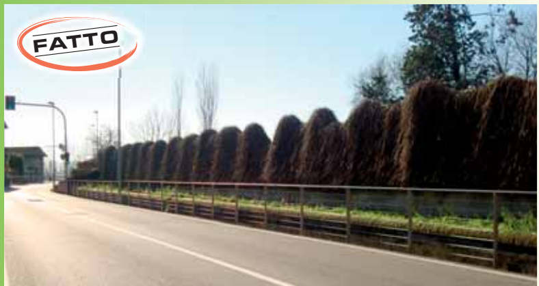
Messa in sicurezza del canale di via Manzoni a Pievedizio, tramite ringhiera realizzata seguendo le indicazioni, su materiali e tipologia estetica, dettate dalla Soprintendenza dei Beni Architettonici e paesaggistici della sede di Brescia.