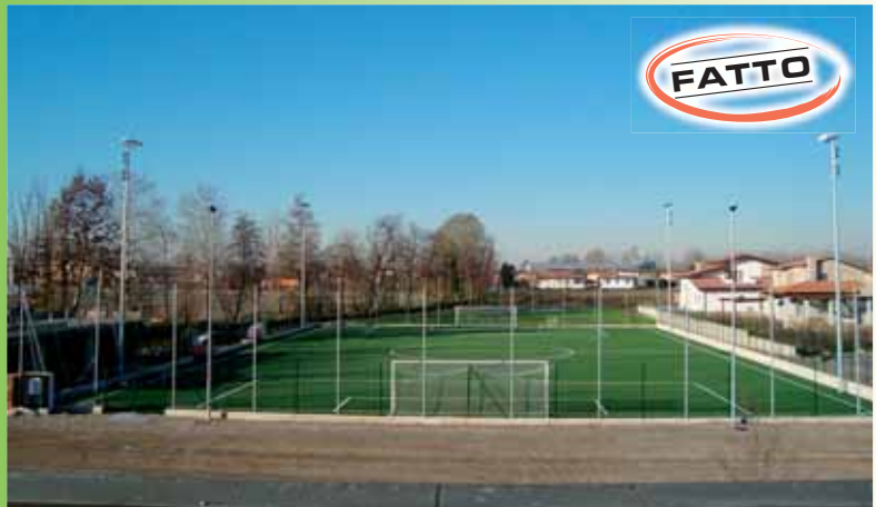
Il nuovo campo da calcio sintetico.